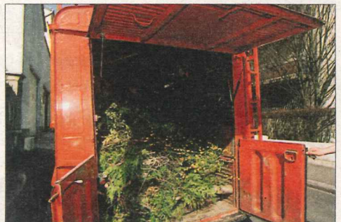
Jean-Paul trouve très pratique ce hayon et les deux portes basses.