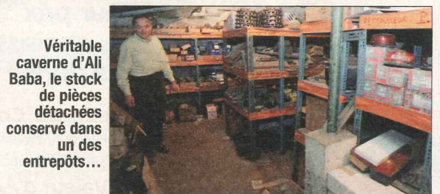
Véritable caverne d'Ali Baba, le stock de pièces détachées conservé dans un des entrepôts...