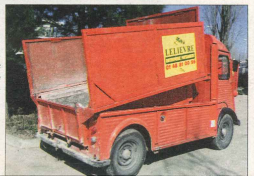
Ce Type H aménagé en benne basculante est une rareté.